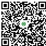
影像醫學科衛教文章 QRCode