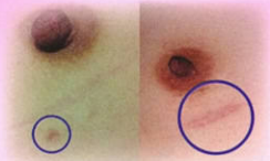
微創傷口 VS. 外科手術